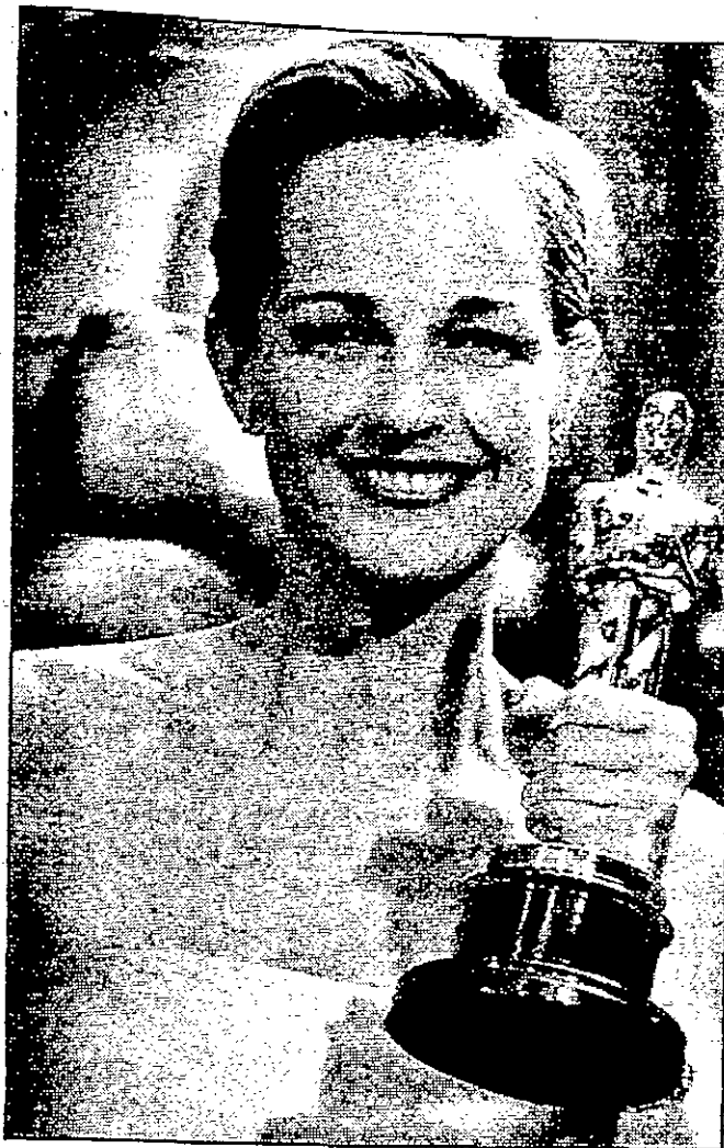
ميشيل فيفر، أفضل ممثلة